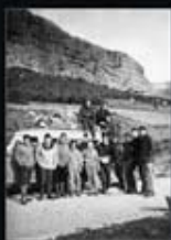
Participants a l'avenç de Solsona