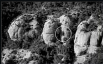
Bassa superior de l'avenç