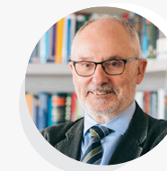
19:50h Sr. RAFAEL RIBÓ Síndic de Greuges de Catalunya