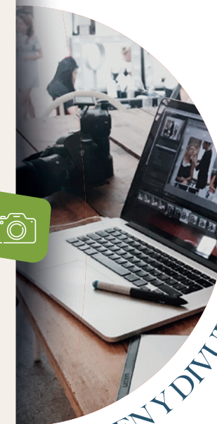
IMAGEN Y DIVULGACIÓN